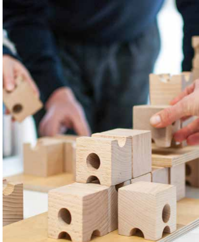
Raum für Wohnprojekte