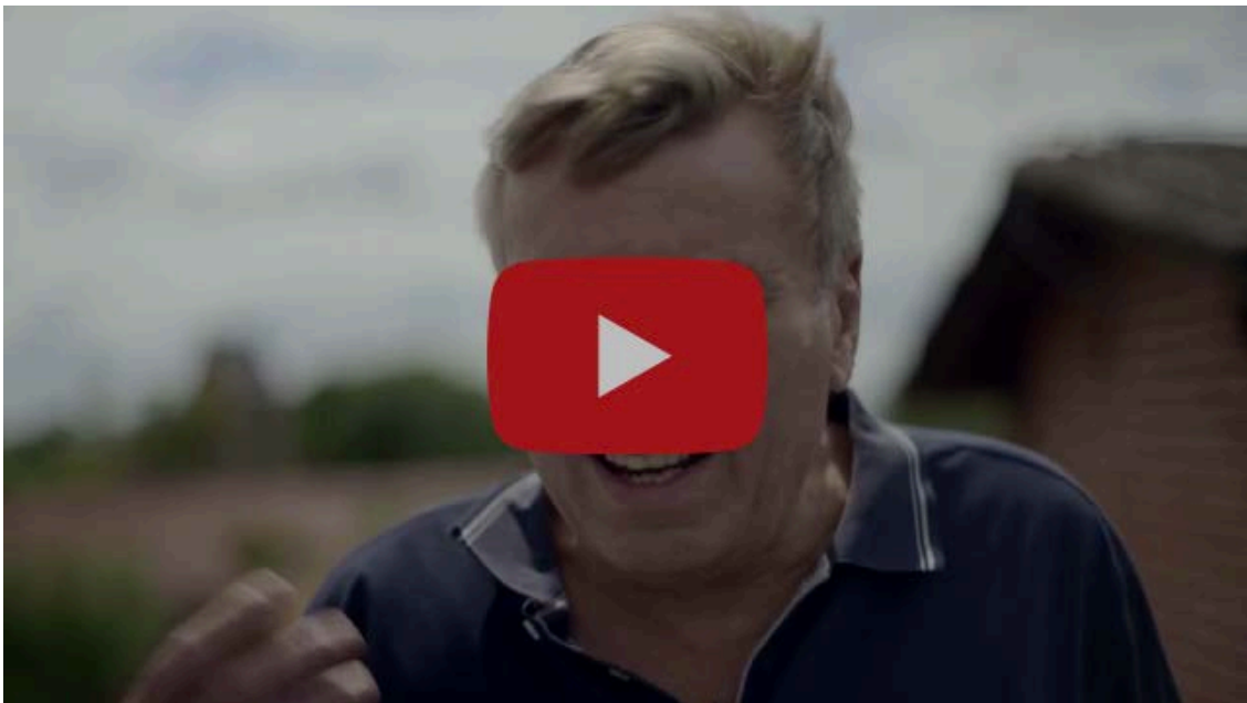
Video Wohnprojekt Hof Prädikow